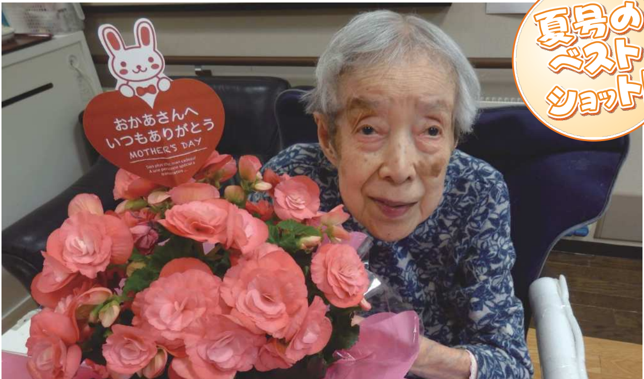
ご家族様からの愛が伝わりますね