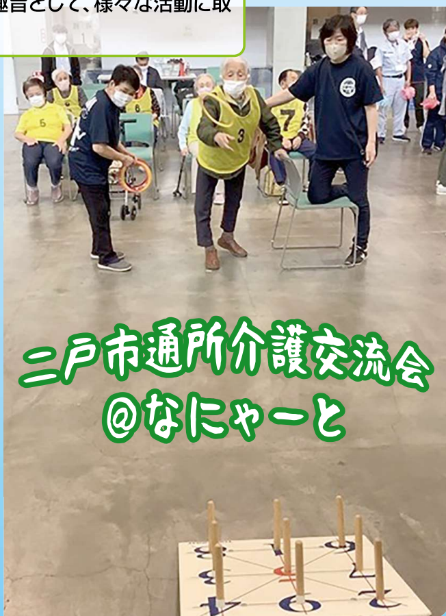
二戸市通所介護交流会 @なにやーと